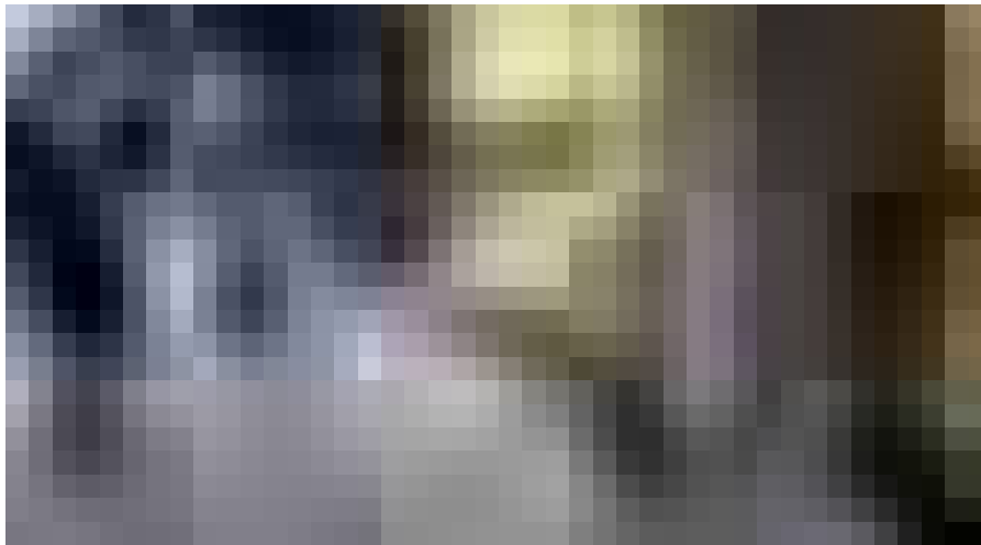
Hommage aux victimes de l'attaque du 11 décembre rue des Orfèvres, près du marché de Noël à Strasbourg, le 21 décembre 2018.

Le 11 décembre 2018, l'attentat de Strasbourg a fait cinq morts et une dizaine de blessés. Néanmoins le nombre de personnes impactées par cette attaque est bien plus large. Un an plus tard, nous abordons les possibles impacts à court et long terme avec une chercheuse.